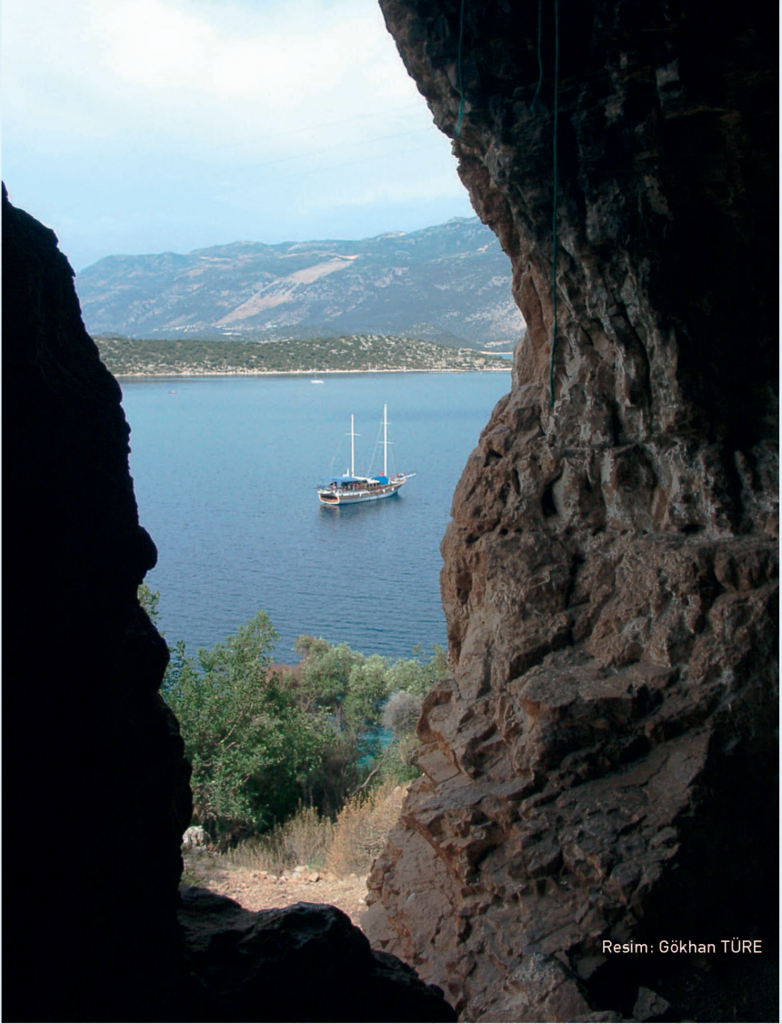
Resim: Gökhan TÜRE