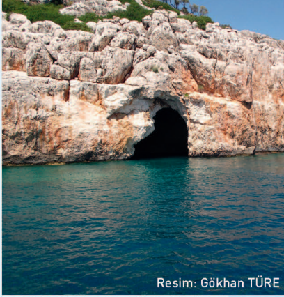
Resim: Gökhan TÜRE

Üçüncü zamandan kalma kalkerler içinde, denizin aşındırmasıyla oluşmuş güzel bir mağaradır.