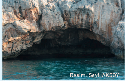
Resim: Seyfi AKSOY

Bu mağara Akdeniz foklarının görüldüğü bir bölgedir. Foklar için özellikle kış aylarında üreme noktası olabilmektedir. Bu nedenle yaz sezonunda dalış yapan turistlerin dalış sırasında dikkatli davranmaları gerekmektedir.