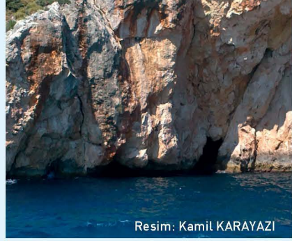
Resim: Kamil KARAYAZI

Bu mağara güvercinler ve Akdeniz fokları tarafından aktif olarak kullanılmaktadır. Özellikle kış aylarında üreme noktası olabilmektedir. Yaz sezonu boyunca bazı turistlerin bu mağaraya deniz taşıtları ve kimi zaman da dala-