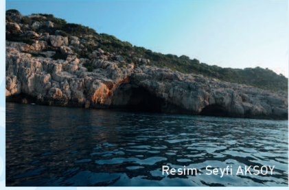
Resim: Seyfi AKSOY