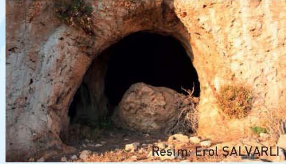
Resim: Erol ŞALVARLI

Kalkan bucağına bağlı Bezirgan köyünün, sahilinden biraz içeride kalan İnbaş mevkiinde oldukça büyük bir mağaradır. Yakınına kadar yol gitmek- tedir.