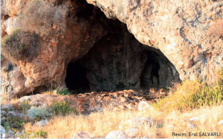
Resim: Erol ŞALVARLI

Kalkan bucağına bağlı Bezirgan köyünün, sahilinden biraz içeride kalan İnbaş mevkiinde oldukça büyük bir mağaradır. Yakınına kadar yol gitmek- tedir.