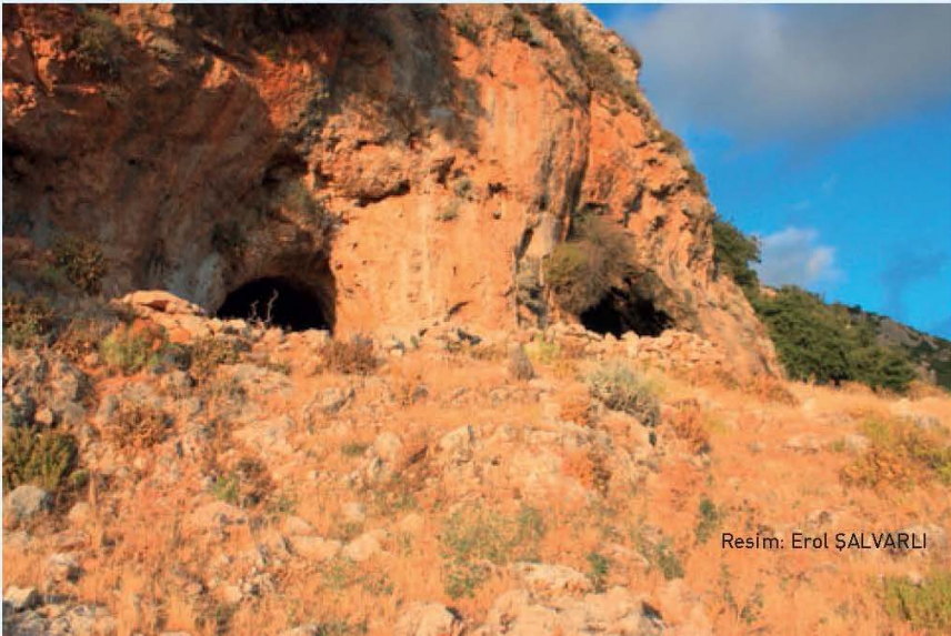
Resim: Erol ŞALVARLI