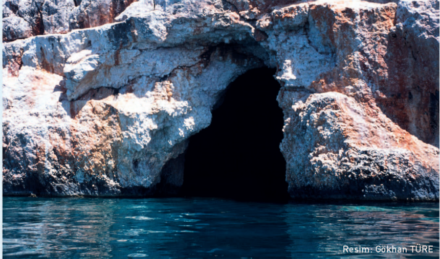
Resim: Gökhan TÜRE

Bazı turistlerin bu mağaraya girmesi, fokların bu bölgeyi üreme alanı olarak kullanmaktan vazgeçmelerine neden olmaktadır.