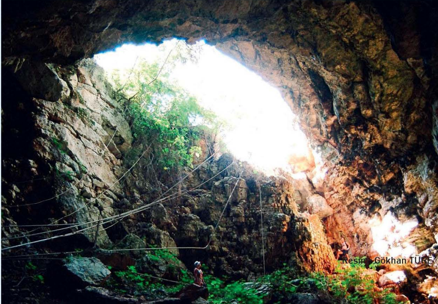
Resim: Gökhan TÜRK

ler. Ayıca Mavi Yolculuk güzergâhında bulunan yatlar da burada demirlemekte ve Antik dönemden kaldığı tahmin edilen Hıdırellez mağarasını ziyaret etmektedirler.