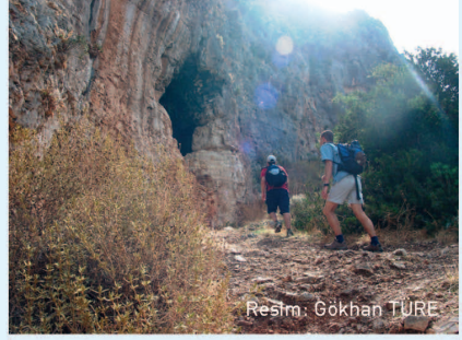
Resim: Gökhan TÜRE

B ayındır köyünün Limanağzı mevki- inde yer almaktadır. Mağara köyün batısına düşmektedir. Halk arasında "Elif mağarası" da denmektedir. Küçük bir mağaradır.