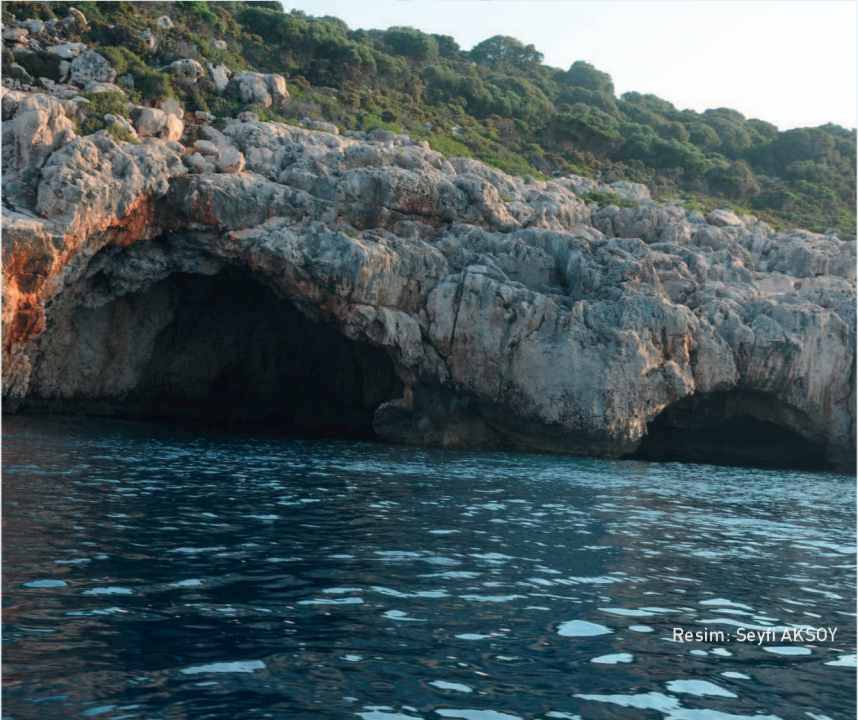
Resim: Seyfi AKSOY