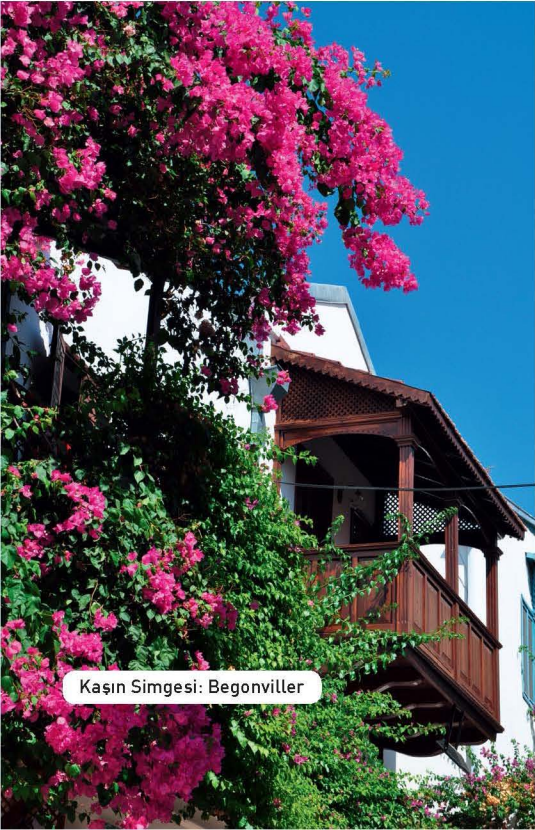
Kaşın Simgesi: Begonviller