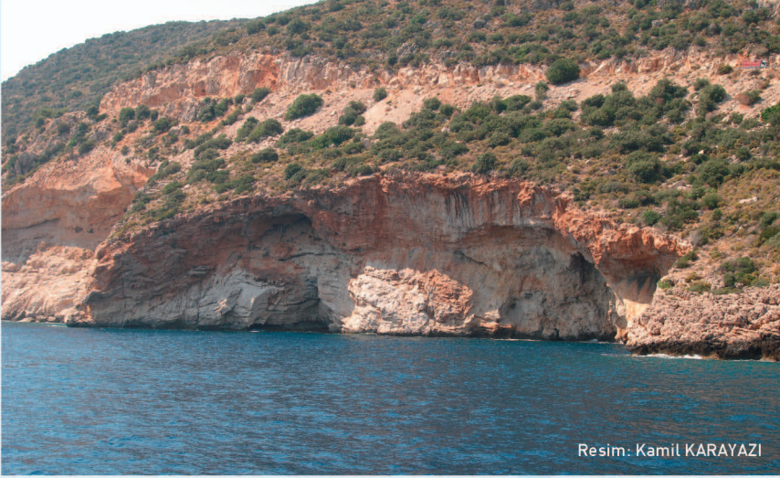
Resim: Kamil KARAYAZI

Akdeniz foklarının üreme alanı olan bu mağaraya yaz sezonu boyunca bazı turistlerin deniz taşıtları ve kimi zaman da dalarak girmesi fokları olumsuz yönde etkilemektedir.