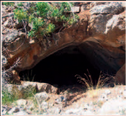
Resim: Kuyucak Belediyesi Arşivi