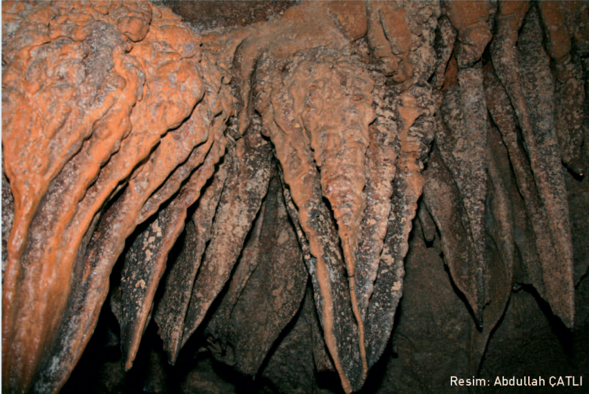
Resim: Abdullah ÇATLI