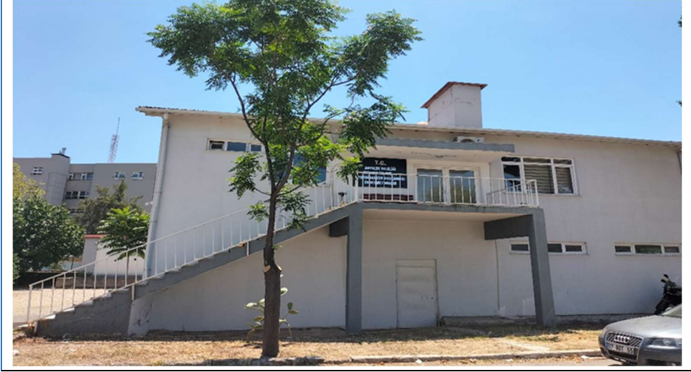
BİNANIN DIŞ CEPHEDEN GÖRSELİ