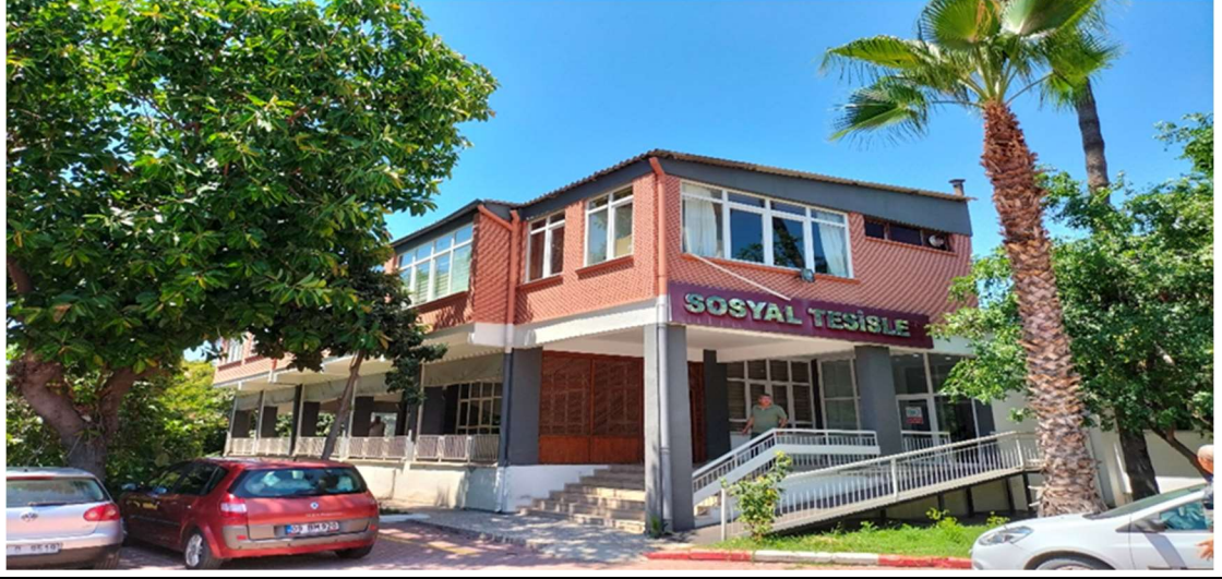
BİNANIN DIŞ CEPHEDEN GÖRSELİ