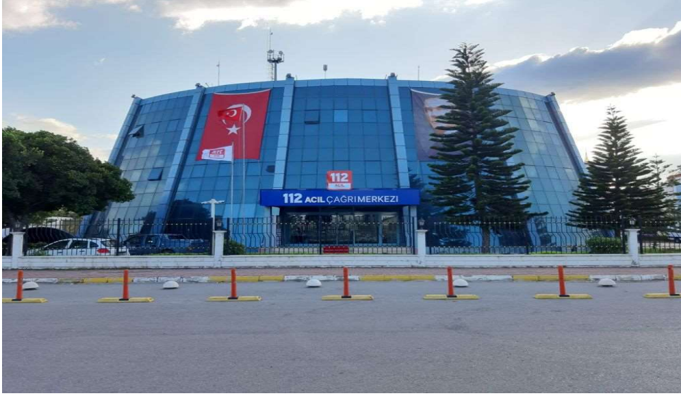
BİNANIN DIŞ CEPHEDEN GÖRSELİ