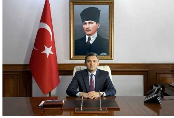
VALİ Hulusi ŞAHİN