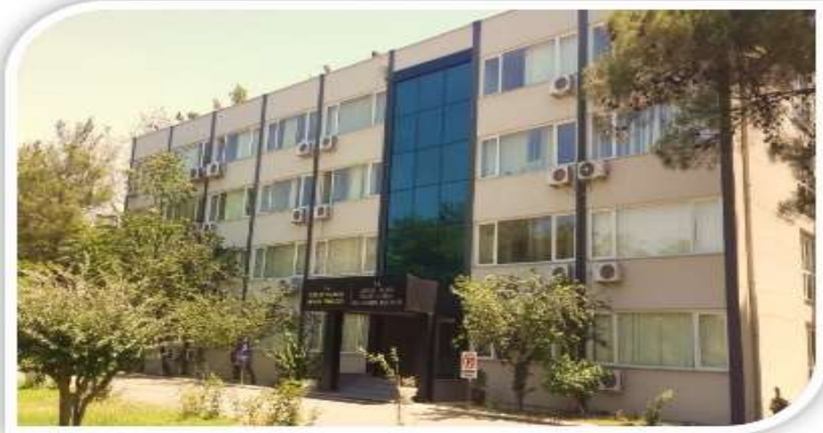
BİNANIN DIŞ CEPHEDEN GÖRSELİ